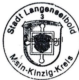
Timo Greuel Bürgermeister